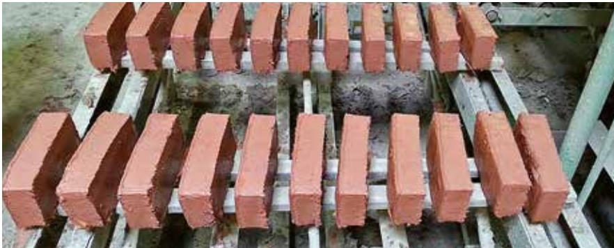
ZUSÄTZLICHE PRODUKTSCHIENE: Die Filterkuchen, mit der Kammerfilterpresse aus Feinstgutsedimenten erzeugt, eignen sich für die Ziegelproduktion.